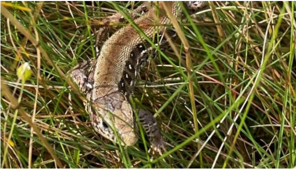
Die Zauneidechse und ihr Lebensraum sind streng geschützt.

Alle geschützten Arten dürfen nicht aus der Natur entnommen und ihre Fortpflanzungs- und Ruhestätten nicht zerstört werden. Das BNatSchG stellt viele einzelne Tier- und Pflanzenarten unter besonderen Schutz und einen Teil davon unter strengen Schutz. Bei besonders geschützten Arten gilt zusätzlich ein Störungsverbot während der Fortpflanzungs-, Mauser-, Überwinterungs- und Wanderzeiten.