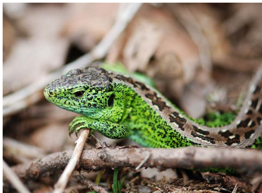
Abbildung 16 Zauneidechse – eine streng geschützte Art.