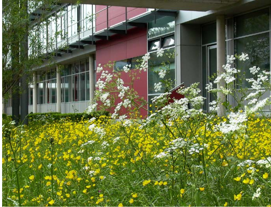
Abbildung 4 Artenreiche Blumenwiese am Gelände des Landesamtes für Umwelt in Augsburg.

Für Insekten stellen die Wiesenblumen Pollen und Nektar bereit. Der Insektenreichtum bedeutet Nahrung für Singvögel, Eidechsen und Kleinsäuger.