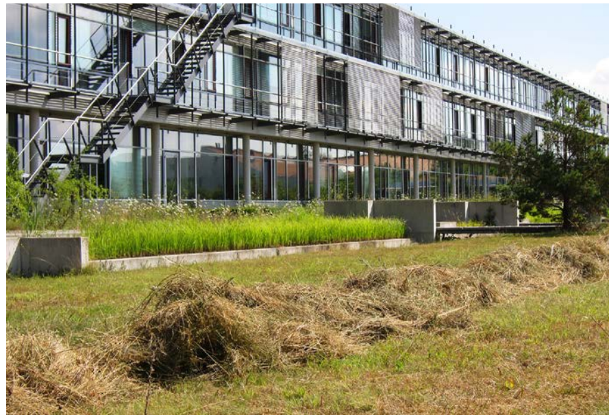
Abbildung 23 Mahd einer Extensivwiese am Außengelände des Landesamtes für Umwelt (Foto: Christoph Bücheler).

Protokoll der durchgeführten Arbeiten, Fotodokumentation) und zu überprüfen. Die Überprüfung und Dokumentation der Pflegedurchführung trägt bereits zur Vorbereitung des nächsten Schrittes – der Erfolgskontrolle – bei.