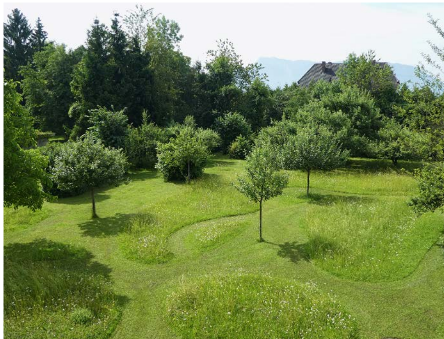
Abbildung 5 Amtsgarten des Amtes für Digitalisierung, Breitband und Vermessung Freilassing (Foto: ADBV Freilassing).

Heimische, an den Standort angepasste Hecken und Bäume bieten Nahrung, Lebensraum sowie Nist- und Brutplätze für Vögel, Insekten und kleine Säugetiere. Sie stellen einen attraktiven Sichtschutz dar und wirken als Staubfilter, Temperatur- und Luftfeuchtigkeitsregulierer.