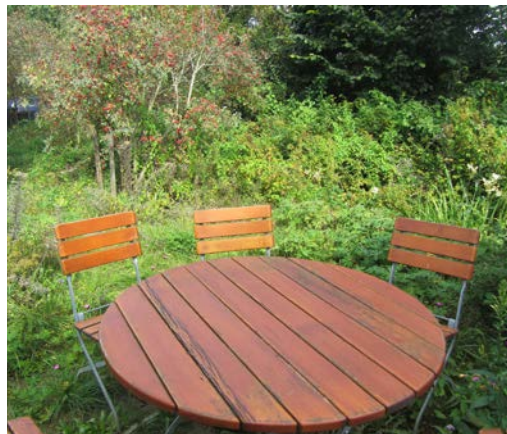
Abbildung 19 Aufenthaltsbereich im Grünen bei Wenninger & Kugler GmbH.