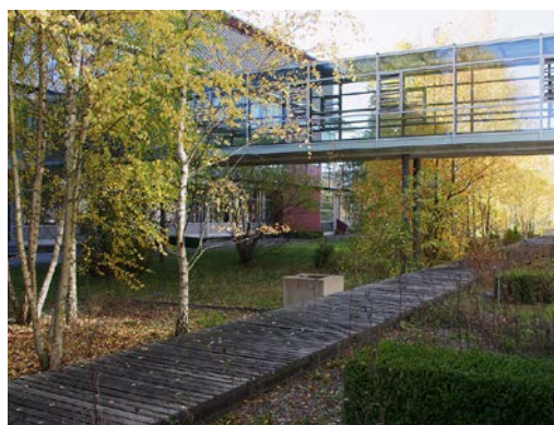
Abbildung 20 Verwendung von Naturmaterialien.