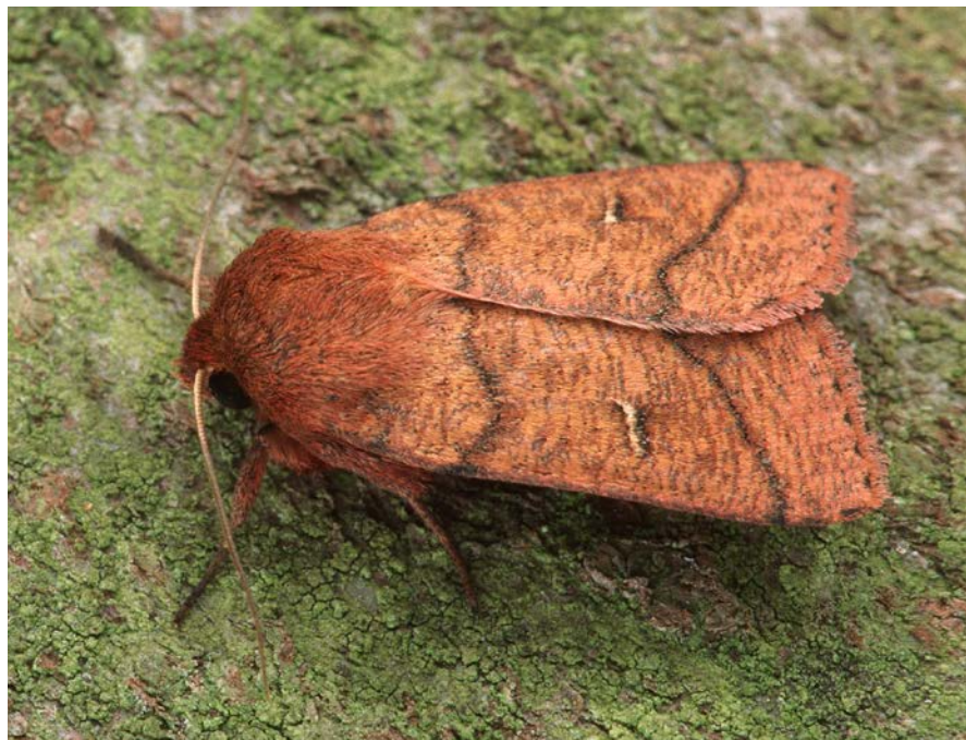
Abbildung 9 Ein nachtaktives Insekt: die rotbraune Gras-Eule.

Insektenfreundliche LED-Leuchtmittel, die nach oben abgeschirmt sind und warmweißes Licht haben, oder die Reduzierung der Beleuchtung beziehungsweise der Einsatz von Bewegungsmeldern vermindern die Anziehungskraft für Insekten. LED-Leuchten verringern dazu den Energieverbrauch und leisten dadurch einen Beitrag zum Klimaschutz.