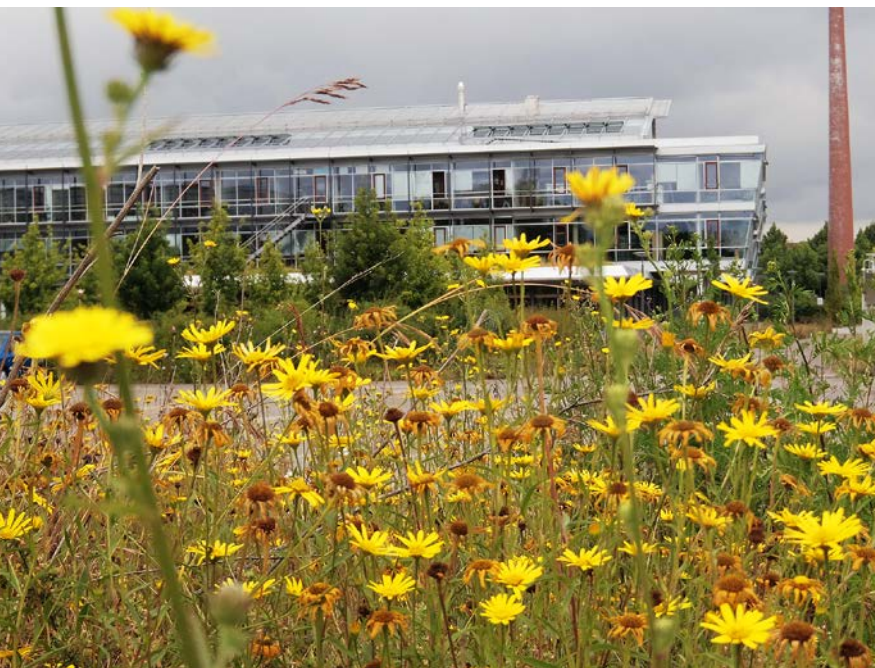
Abbildung 21 Blüten- reiche Wiesenansaat am Außengelände des Lan- desamts für Umwelt.