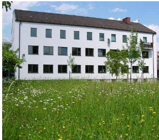
Abbildung 18 Öffentlich zugänglicher Amtsgarten des Vermessungsamtes in Freilassing.