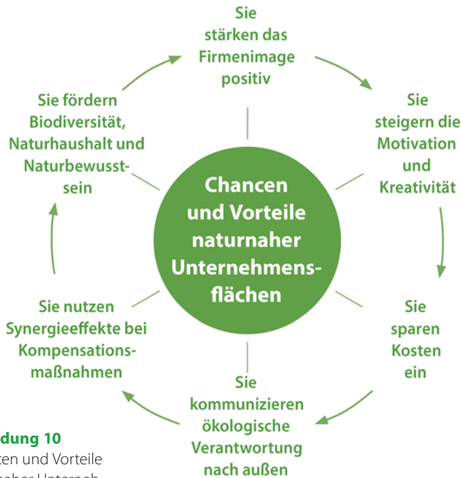
Abbildung 10 Chancen und Vorteile naturnaher Unternehmensareale.

Welchen Mehrwert haben naturnah gestaltete Unternehmensflächen?