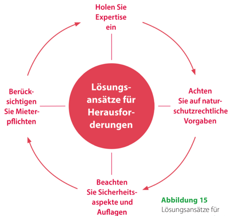
Abbildung 15 Lösungsansätze für mögliche Herausforderungen und Risiken.

Es empfiehlt sich, vor einer geplanten Umgestaltung mit Fachplanern und den zuständigen Naturschutzbehörden in Kontakt zu treten. Falls die Ansiedlung von streng geschützten Arten zu erwarten ist, kann in Bayern von den Naturschutzbehörden unter bestimmten Bedingungen eine artenschutzrechtliche Ausnahmegenehmigung nach § 45 Abs. 7 Satz 1 Nr. 1, 4 oder 5 BNatSchG oder eine Befreiung nach § 67 (2) in Aussicht gestellt werden.