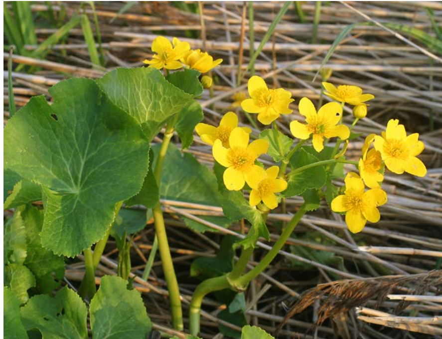
Abbildung 8 Naturnahe Bepflanzung eines Teiches mit Sumpfdotterblumen.

Als Teil des Regenwassermanagements ergeben sich zusätzliche Vorteile: Niederschlagswasser, das versickert, trägt zur Grundwasserneubildung bei. Regenwasser, das zurückgehalten wird, reduziert Hochwassergefahren. Zudem vermindern größere Wasserflächen eine Überhitzung im Sommer. Gleichzeitig können am Gewässerrand Lebensräume für Feuchtvegetation, Insekten, Amphibien und Vögel entstehen.